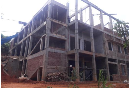
ருவன்வெல்ல நீதிமன்றக் கட்டிடத் தொகுதி