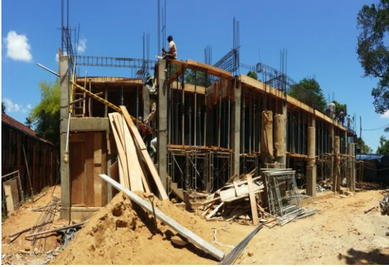
வலஸ்முல்ல புதிய நீதிமன்ற கட்டடம்