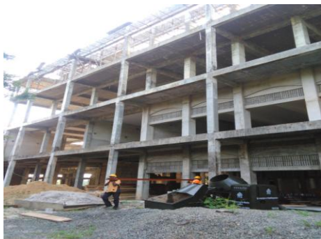
காலி நீதிமன்றக் கட்டிடத் தொகுதி