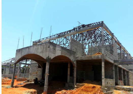
முல்லைத்தீவு நீதிமன்றக் கட்டிடத் தொகுதி