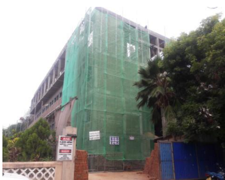
யாழ்ப்பண நீதிமன்றக் கட்டிடத் தொகுதி