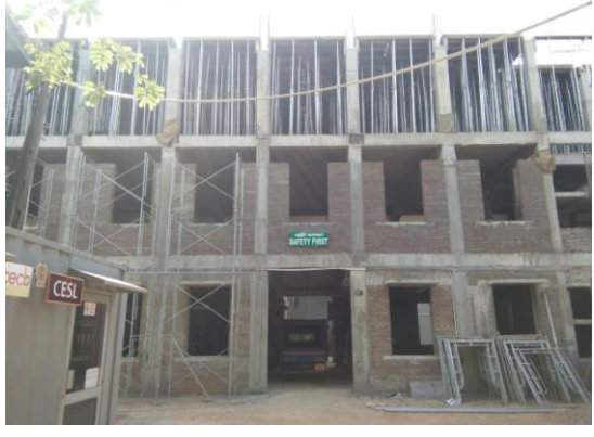
அநுராதபுரம் நீதிமன்றக் கட்டடத் தொகுதி