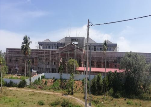
மாத்தறை நீதிமன்றக் கட்டிடத் தொகுதி