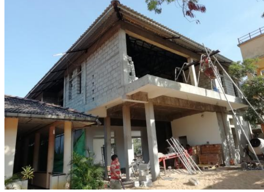
கல்முனை குடியியல் மேன்முறையீட்டு நீதிமன்றம்