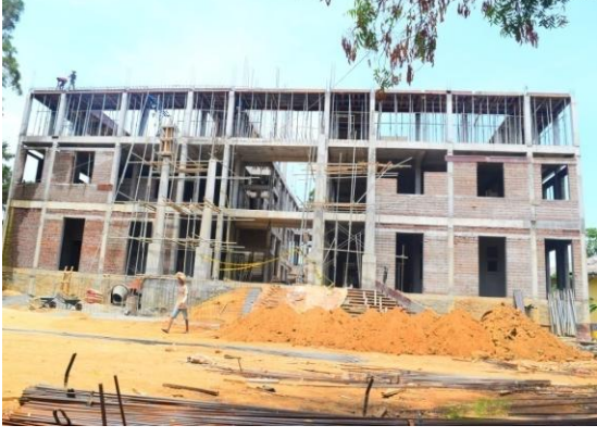
பொலறுவை நீதிமன்றக் கட்டடத் தொகுதி