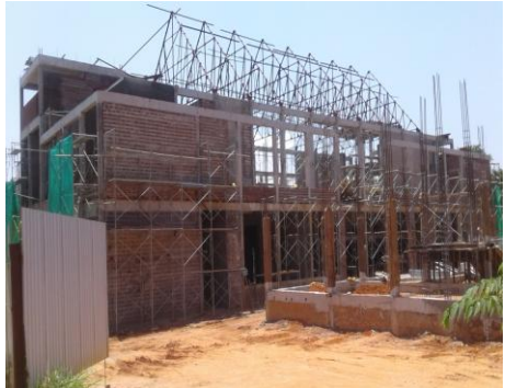
கம்பளை நீதிமன்றக் கட்டிடத் தொகுதி