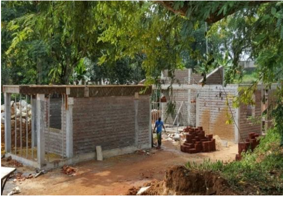
மாத்தளை நீதிமன்றக் கட்டடத் தொகுதி