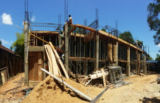
වලස්මුල්ල නව අධිකරණ ගොඩනැගිල්ල