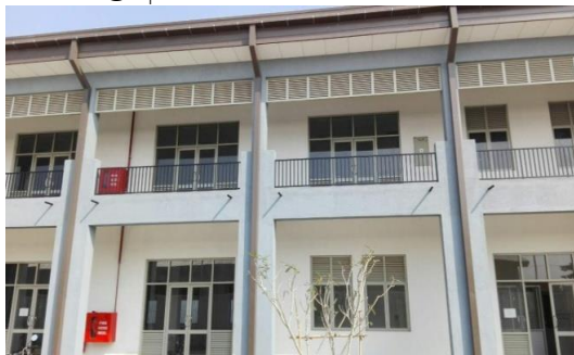
වත්තල අධිකරණ සංකීර්ණය