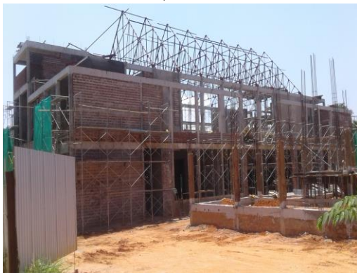
ගම්පොල අධිකරණ සංකීර්ණය