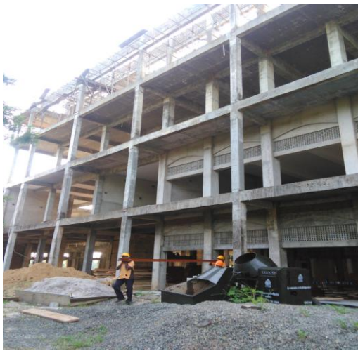
ගාල්ල අධිකරණ සංකීර්ණය