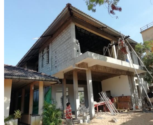
කල්මුණේ සිවිල් අභියාචනාධිකරණය