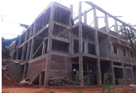
රුවන්වැල්ල අධිකරණ සංකීර්ණය