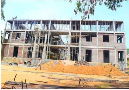
පොලොන්නරුව අධිකරණ සංකීර්ණය