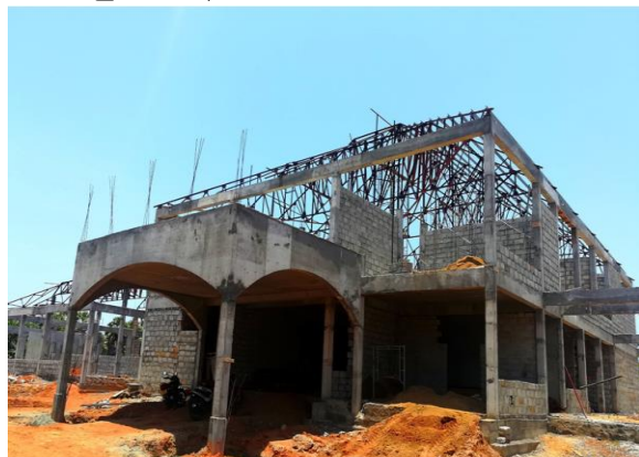
මුලතිව් අධිකරණ සංකීර්ණය