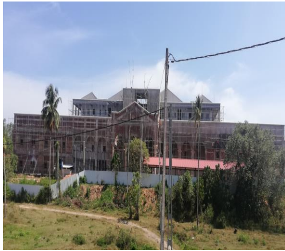
මාතර අධිකරණ සංකීර්ණය